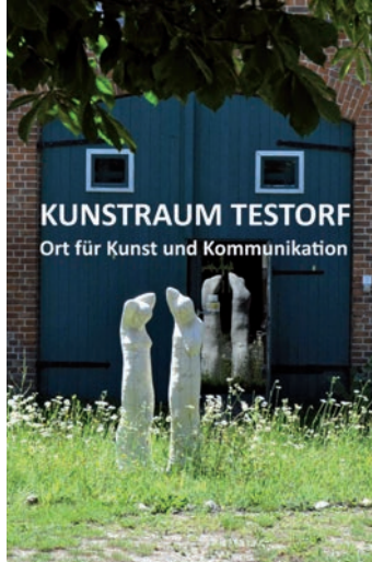
KUNSTRAUM TESTORF Ort für Kunst und Kommunikation

Künstlerinnen aus Lettland, den USA und Deutschland nahmen auf Einladung von Anke Meixner 2024 an der Sommerwerkstatt im Kunstraum Testorf teil. Hanf und andere heimische Fasern wurden künstlerisch erforscht.